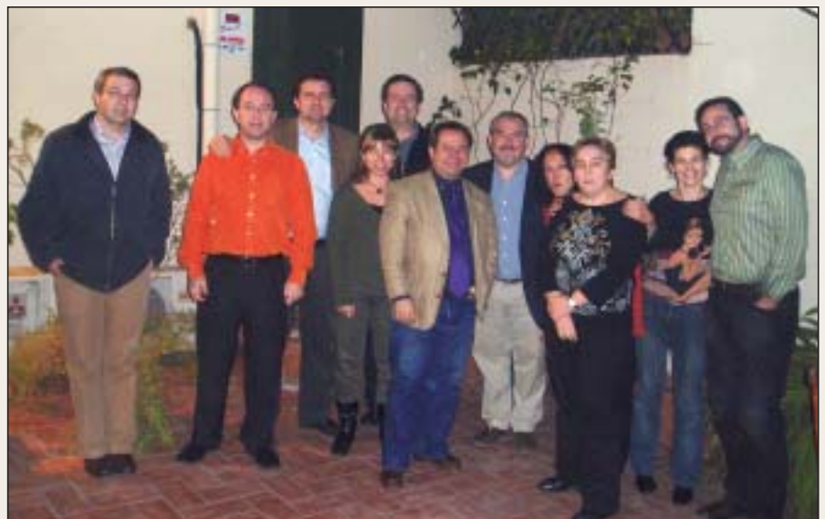
Miembros de Junta entrante y saliente en una de sus primeras reuniones en Barcelona

-La semFYC y las 17 sociedades federadas están en buena forma, gracias al empeño y al esfuerzo de multitud de profesionales