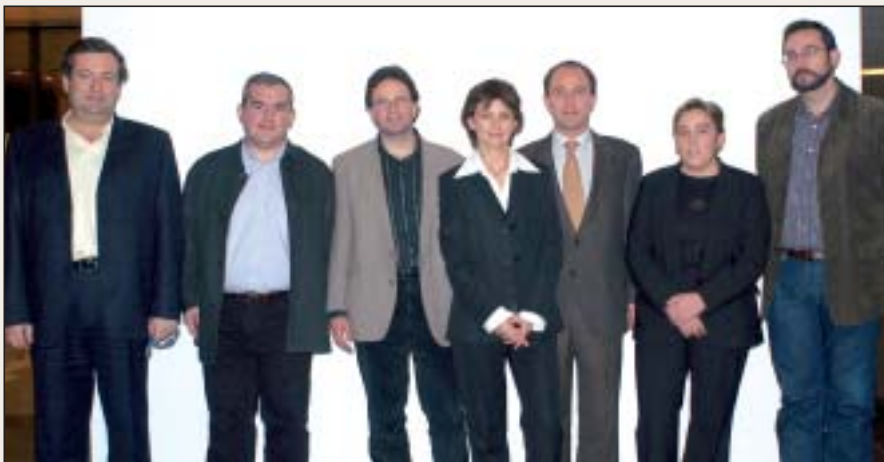
Miembros de la Junta Permanente que se renueva en 2007

-Por supuesto. Nosotros proponemos cuatro medidas fundamentales: Facilitar las condiciones de trabajo en los centros de salud para que los médicos con cualidades y vocación por la investigación puedan desarrollarla. Promover líneas de investigación con financiación pública que permitan la traslación a las necesidades de los pacientes de los resultados de la investigación básica. Atraer los fondos privados, que representan el grueso de la investigación en salud, con proyectos en Atención Primaria. Crear y favorecer el desarrollo de una gran red de investigadores que permita que se convierta en una realidad el I+D+i en el primer nivel asistencial. Creemos que las decisiones adoptadas en los últimos tiempos por el Instituto Carlos III no favorecen la investigación en Atención Primaria y proponemos una gran alianza entre las fundaciones creadas por algunas comunidades autónomas para conseguir saltos cualitativos. Desde la semFYC estamos dispuestos a actuar como facilitadores y vertebradores de la investigación, tal como hemos contribuido con la creación de las RediAP, la Red de Investigación en A.P.