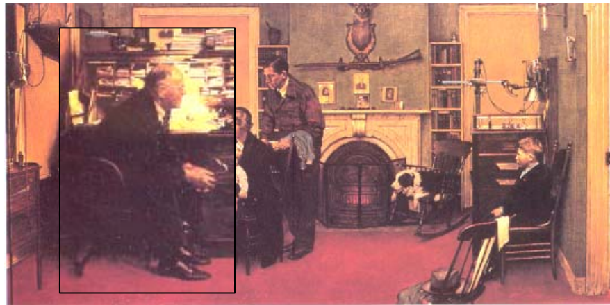
El médico de familia, Norman Rockwell (1947)

Tratamiento de la hipertensión por médicos de familia y especialistas de medicina interna